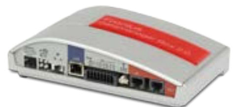
/ Fronius Datamanager Box 2.0