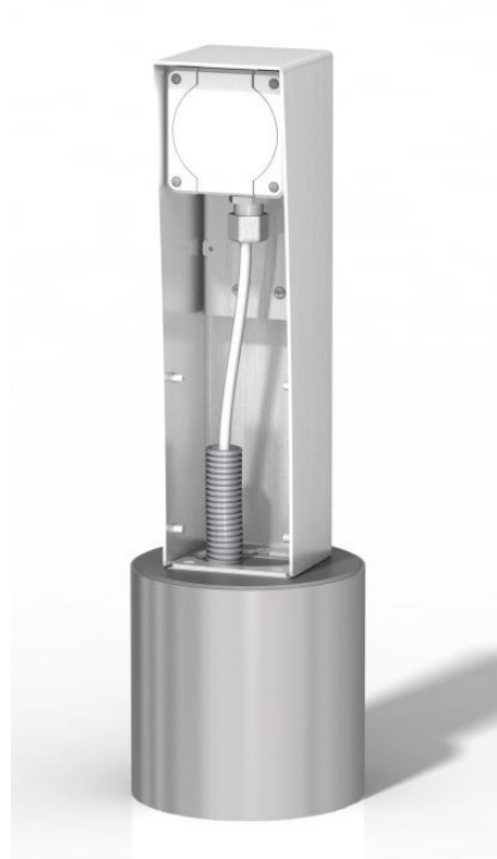
Montage einer ESOCKET 350 Energie-säule auf dem Fundament mit Ankerkorb DS-12219-10